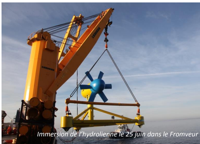
Immersion de l'hydrolienne le 25 juin dans le Fromveur

ce qui se passe. A terme l'objectif est de couvrir 15% des besoins en électricité d'Ouessant.